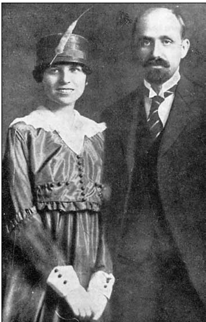
ZENOBIA CAMPRUBÍ I JUAN RAMÓN JIMÉNEZ EL DIA DEL SEU CASAMENT

Un espai real metafísic en què la presència atuïdora de la llum –paradoxalment– és anul·lació de la vida. Per això, contra la il·luminació engegadora de la poesia objectual, que sovint enlluerna els mateixos autors que la intenten, fins al punt que els versos no els deixen veure el poema, Antoni Clapés tria la reflexió , una opció que el porta a apartar-se de l'aparent naturalitat tel·lúrica de l'esclat per conduir el discurs líric cap a la màxima abstracció conceptual, que és, en definitiva, un cop engegada la història, l'autèntica realitat humana, per molt que s'hi vulguin oposar els bons salvatges de la paraula. ▶▶▶