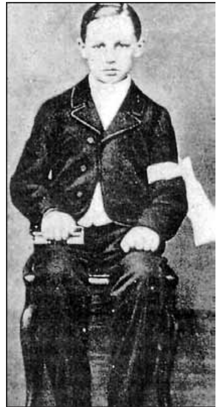
ARTHUR RIMBAUD FENT LA COMUNIÓ

"Espai deseïtat d'afany, de sofriment: inabastable, aquesta mar d'arena i de vent que travesses –feixuc, lent– i que t'acull en la seva desolada solitud. [...] Infinita repetició d'un mateix, únic paisatge