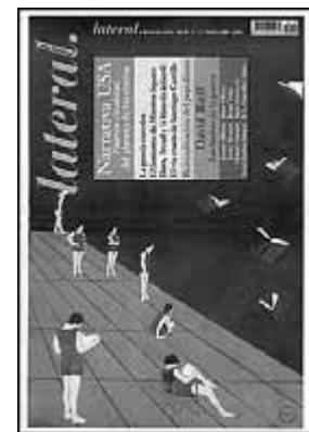
Lateral. Número 110. LATERAL EDICIONES, SL. BARCELONA, FEBRER, 2004.

El dossier central està dedicat a La quadratura del gòtic. Catedrals catalanes . Fèlix Fanés signa un article en què fa una comparativa entre les obres de Josep Pla i Nikolai Gógol. També s'hi comenta l'exposició de Torres-García al Museu Picasso de Barcelona.