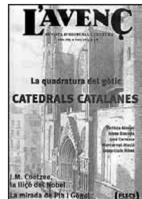
L'Avenç. Número 289. L'AVENÇ, SL. Barcelona, març, 2004.