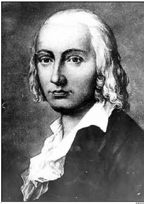
EL POETA ALEMANY HÖLDERLIN

La paraula es posa a prova en els intents d'articulació de nous sentits, en les perífrasis que descriuen tot allò que no té cap nom