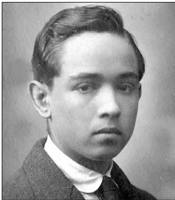
UNA IMATGE DEL POETA ADOLESCENT DE L'ANY 1917

Núria, des de París, on havia anat a buscar novetats avantguardistes per a la Llibreria Nacional Catalana, i des dels sanatoris on es va estar per fer cura de la seva malaltia. També és interessant la correspondència amb l'escriptor Peius Gener (1848-1920). Salvat li va escriure, l'any 1918: "Jo us prego que vulgueu anomenar-me Salvat-Papasseit i deixiu el Gorkiano com a cosa passada i morta i tot, doncs aquest dit pseudònim ve de Gorki, el que equival a dir pertànyer a una escola, tot cas que el rebel rus hagués format escola. Salvat-Papasseit vol dir jo mateix, vol dir lo que cal saber". Entre la documentació sobre Salvat-Papasseit també hi ha la primera edició de L'irradiador del port i les Gavines i una postal del fons del col·leccionista Borràs que Salvat va enviar als seus amics Josep M. de Sagarra i Joan Crexells, d'estudis a Alemanya. Tot parlant de la situació a Catalunya, Salvat, comentà: "[...] de totes maneres, allò de la independència encara és bastant lluny, no us feu, doncs il·lusions". La majoria d'aquest material documental va servir de base per a la realització del llibre biogràfic Joan Salvat-Papasseit, l'home entusiasta (Virus, 2002), fet per mi mateix conjuntament amb Remei Morros.