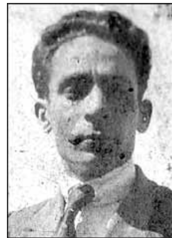
A FUENTFRÍA, EL 1922