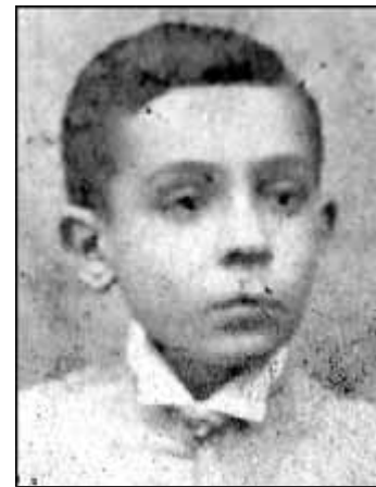
EL POETA EL 1907