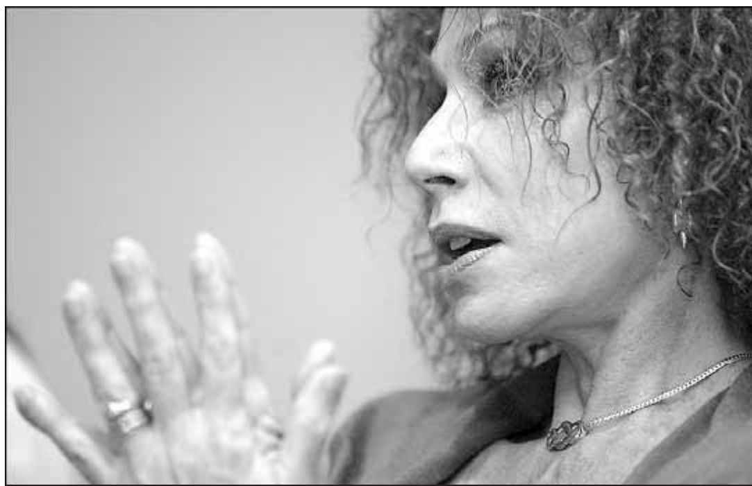
Julia Migenes recorre a Piazzolla per mostrar el caràcter de la dona argentina

aquest permet que Migenes demostrï, una vegada més, que és una artista versàtil. Considerada una de les veus líriques més aclamades a nivell internacional, el seu talent es va revelar amb la interpretació del paper de Carmen en la pel·lícula de Francesco Rossi. Preguntada sobre si cal més passió per donar