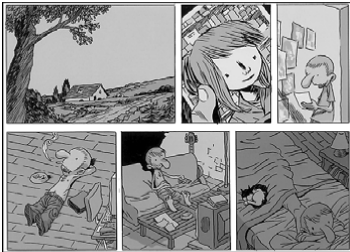
MANU LARCENET / NORMA EDITORIAL