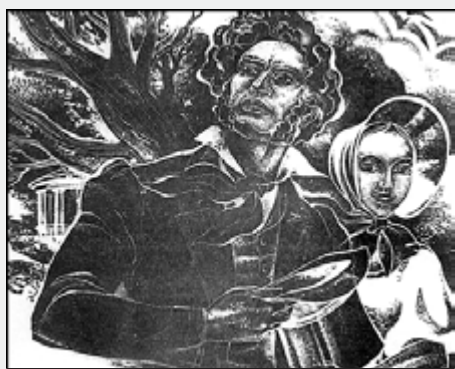
ALEKSANDR S. PUIXKIN