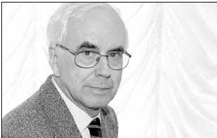
Josep Maria Espinàs