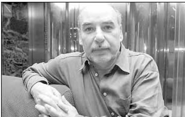
Tahar Ben Jelloun