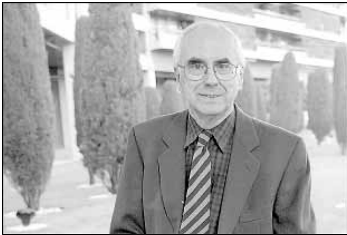
Josep Maria Espinàs