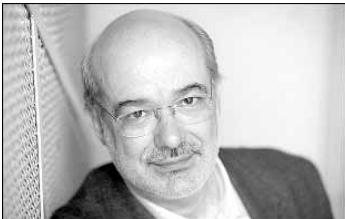
Josep Maria Terricabras