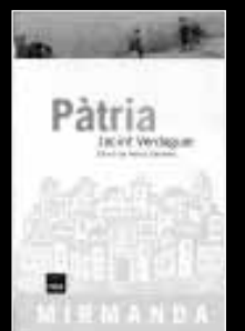
Pàtria Jacint Verdaguer Edició de Narcís Garolera