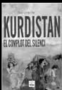
Kurdistan. El complot del silenci Obra col·lectiva