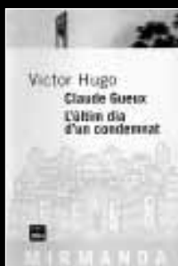
Claude Gueux. L'últim dia d'un condemnat Victor Hugo