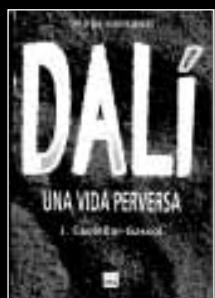
Dalí. Una vida perversa Joan Castellar-Gassol

L'obra ens explica una història d'amor entre dues persones solitàries que senten una gran atracció mútua, però que han de lluitar contra el fet que sempre han sigut escèptiques davant del sentiment amorós. Segons la mateixa autora, la novel·la "és una reflexió sobre la solitud humana i l'egoisme". El protagonista masculí de L'home que volava en el trapezi treballa en una editorial, una circumstància que Isabel-Clara Simó ha aprofitat per despatxar-se de gust contra la vanitat dels editors i l'estupidesa dels crítics rebentaires. A tots els pica la cresta, convençuda que el món editorial ha perdut la perspectiva que la literatura és una indústria, però també cultura.