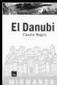
El Danubi Claudio Magris