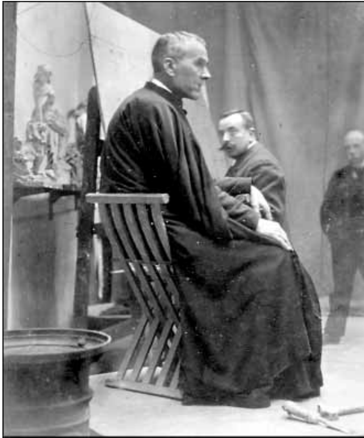
Biblioteca de Catalunya

D'aquestes, Canigó va ser l'obra més celebrada per tot hom. Publicada l'any 1886 -tot i que va aparèixer a les darreries del 1885-, la composició és, d'una banda, la culminació dels esforços que Verdaguer havia anat fent per compondre el gran poema èpic de la nostra literatura i, de l'altra, la mostra literària de les inquietuds polítiques, civils i religioses d'una època. Verdaguer barreja, "dormint en mon somni nou", gestes històriques amb personatges fabulosos i llegendaris, per crear la història fantàstica de Gentil i de la fada Flordeneu , una història que havia d'explicar els orígens mítics de Catalunya. L'empresa el va portar a la recerca d'informació geogràfica, folklòrica i lingüística de les terres més septentrionals del Principat durant quatre anys. I el resultat és potser el seu poema de més volada, amb l'afegit que va