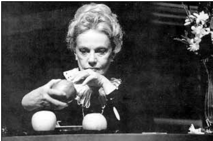
L'actriu francesa Jeanne Moreau va visitar el festival l'any 1988