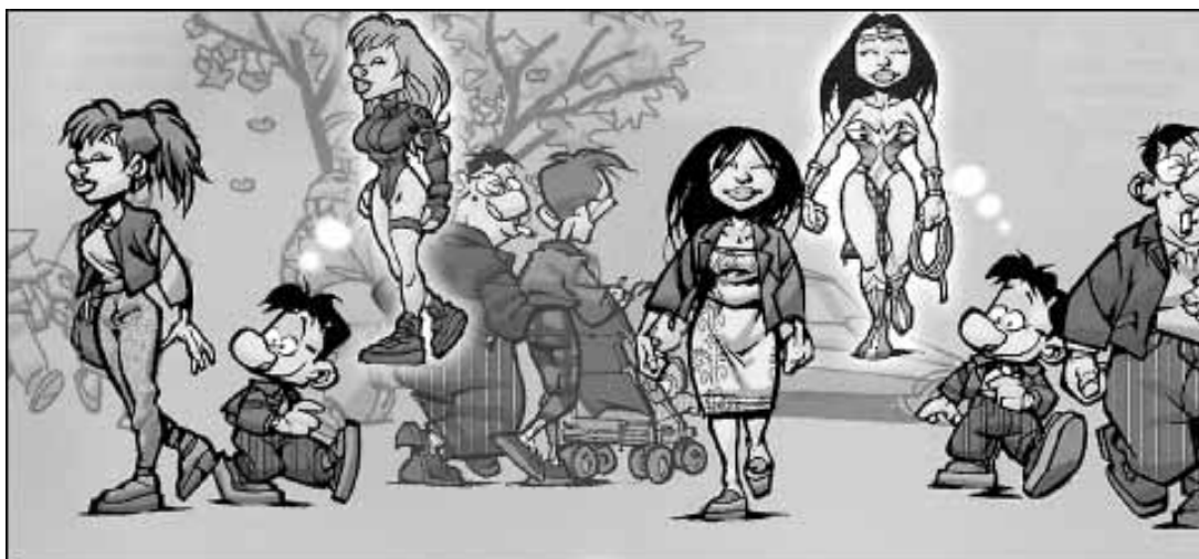
Una sèrie d'il·lustracions entrelligades de 'Total Hero'

L libre d'autoajuda sense maquillatges. La cara s'omple de grans, surten pèls a les cames, el cos es comença a inflar... L'adolescència està plena de canvis, tant en el cos com en la manera de pensar. I això crea molts dubtes. El llibre és una guia tant per a joves com per a adults que estan en contacte amb adolescents. El seu avantatge és no dir res de nou. Simplement constatar-ho i ordenar-ho.