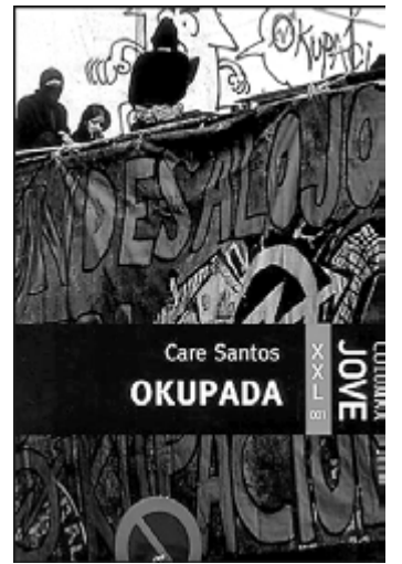
Care Santos, Okupada . Col·lecció Columna Jove XXL . COLUMNA. Barcelona, 2004. A partir de 15 anys.

Recull de contes brevíssims, amb missatges que conviden a reflexionar i amb un caràcter universal que no només fa que els lectors s'identifiquin amb els protagonistes sinó que els introdueix en l'univers dels infants.