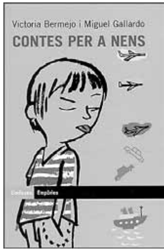
Victoria Bermejo, Contes per a nens . Il·lustracions de Miguel Gallardo. Col·lecció L'odissea . EMPÚRIES. Barcelona, 2004. A partir de 8 anys.

Les il·lustracions de Gallardo s'escapen també de l'estil nintaire amb què tantes vegades es dona vida als personatges de la literatura infantil. Gallardo opta per unes làmines dominades pel color de fons, i perfila els personatges amb traços simples, amb poca definició, amb mirada adulta, esquitxa les diverses pàgines del llibre amb dibuixos més reduïts que els principals, i tendeix a una representació pròxima al cartellisme, com si l'il·lustrador no gosés ocupar gaire espai ni tampoc més protagonisme del que té el text de la novel·la.