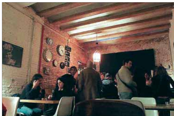
L'Almazen, el petit bar teatre del Raval