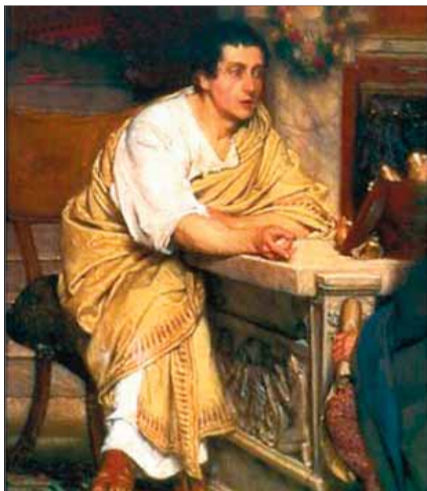
Juli Cèsar també hauria fet hipogrames. SP

La teoria era que els versos saturnis amaguen les seqüències de lletres que els van generar. Segons la tesi mai comprovada de Saussure, en tota l'escriptura antiga hi hauria una mena de llavor lletrada —un mot clau— de la qual després sorgeix el text, desplegat. De fet, el mateix mot clau, al qual tan aviat anomena anagrama com hipograma , paramorfo maniquí , apareix en molts versos del mateix poema. En un fragment del segon cant de L'Eneida Saussure troba deu vegades les lletres de PRIAMIDES. Els hipogrames apareixen, amb les lletres perfectament ordenades, entre els versos 268 i 297. Fascinat, anota al quadern que acaba de descobrir el secret de l'escriptura dels antics. Eureka! I li sembla que no es limita a la poesia, perquè també descobreix hipogrames a la prosa de Juli