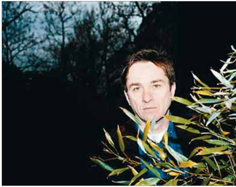
El novel·lista senegalès en llengua francesa Marc Dugain.

Recentment, l'escriptor en llengua francesa Marc Dugain (Senegal, 1957) ha aprofitat el perfil d'espia d'Edgar Hoover per escriure una obra sensacional, La maledicció d'Edgar . Narrada en clau fictícia, com si es tractés de les memòries del seu ajudant i amant Clyde Tyson, la novel·la descriu un dels personatges més intrigants i subversius que ha conegut la història, només comparable amb el Fouché de Stefan Zweig. S'hi retrata un home que no té cap mena d'escrúpols per embrutir-se a les clavegueres i els desguassos del poder; i que ha fet un art de la seva feina d'espia. Racista, misogin, anorèxic i marcat per un pare amb les facultats mentals alterades i una mare omnipresent, el Hoover de Dugain és malpensat i paranoic, amb una homosexualitat mal assumida, una ira desbocada quan les coses no surten com ell vol i crisis d'ansietat constants. Amb aquestes credencials no és d'estranyar que un dia acabés passant per un divan. Però l'experiència tan sols va servir perquè a partir d'aquell moment Hoover projectés el seu odi cap als psicoanalistes: