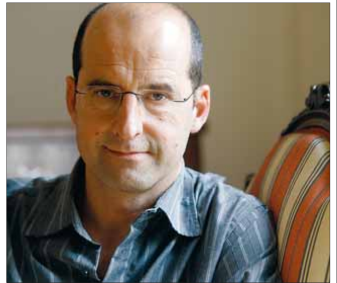
Busquets ha publicat un recull de relats. MIQUEL ANGLARILL

La novel·la repassa els moments públics més rellevants i populars de la història dels EUA, però vistos des d'una òptica privada. L'assassinat de Kennedy i la mort de Marilyn Monroe són investigats per aquest fanàtic de l'ordre i de les antiguitats que era Edgar Hoover: un home que, com tots aquells a qui espia, es comportava com una llegenda abans d'haver demostrat res.