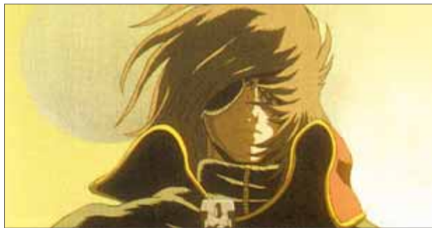
Aquest és l'aspecte del capità Harlock.

Un esperit lliure recorre les galàxies a bord de la seva nau. El capità Harlock és un pirata de l'espai que comanda l' Arcàdia , un mena de galió sideral amb un ordinador central que té vida pròpia. L'acció té lloc el 2977, quan els humans han colonitzat pràcticament tota la galàxia i la corrupció regna a l'Univers. Harlock és una mena de capità Nemo, que ha decidit passar de la humanitat i establir les seves pròpies lleis. En el seu cas, l'anarquia és la màxima. Ell fa