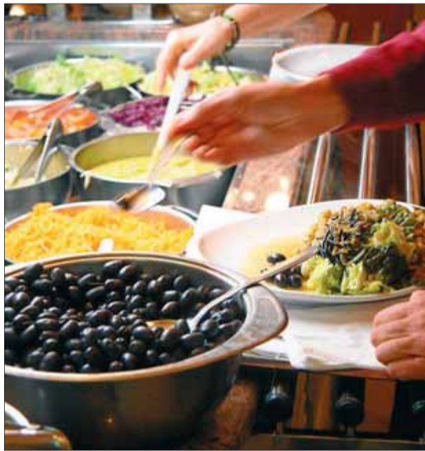
Ingredients per a una amanida palindròmica. JORDI GARCIA

La veritat és que la carta de cal Sabas fa goig, tot i que només obrir-la topis amb un aperitiu tan inquietant com A la mala (cafè amb porros; porros vegetals, s'entén, que, si no, no seria pas un aperitiu però potser tampoc no ens inquietaria tant). Entre les amanides destaquen La ruta natural (d'endívies amb formatge blau, tomàquets secs, pomes caramel·litzades, vinagreta de mel, balsàmic i ajonjolí) i