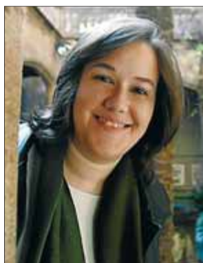
C. Casanova. M. ANGLARILL

França, segle XII. Els enfrontaments entre senyors feudals estan a l'ordre del dia, i també les aliances i les traïcions en una societat marcada per la