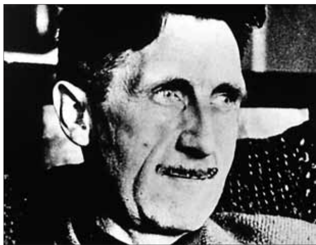
El periodista i narrador George Orwell.