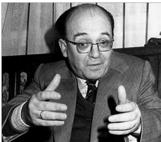
El poeta Vicent Andrés Estellés. XAVIER VALLS

Un lector anònim valencià m'envia un llibret amb tres peces teatrals breus de Vicent Andrés Estellés. Du per títol Dos drames i una farsa (Denes; València, 2002), amb la paraula farsa subratllada. Veig que és una edició del bon amic Francesc Calafat. No coneixia pas la faceta teatral d'Estellés. La curiositat m'empeny a començar per la tercera peça, tot i que en realitat no du per títol Farsa i prou, sinó Farsa dels joves amants . És un text esbojarrat i brevíssim en el qual un capità de 50 anys recomana un llibre a una vella minyona de 70, "gruixut i migtediós, però celestial, balsàmic, incitant: és el llibre dels llibres, el llibre per antonomàsia", que resulta ser un diccionari. El capità espanta la minyona. Quan fuig apareixen dos joves enamorats: la filla del capità i un assistent. El capità busca un altre llibre i els el mostra: "¡Damunt aquest modestíssim llibret de peseta bastiré el temple de la meua saviesa! És un llibre de mots encreuats. [...] Vaig anar omplint els seus buits i vaig anar experimentant una sensació notable de grandesa, fins i tot d'un cert pànic: ¡allò era únic! ¡Una experiència única! Amb fúria, vaig anar fent un darrere l'altre tots els mots encreuats que hi havia al llibre, fins que vaig pensar que coneixia tot el secret del joc, de l'assumpté". El capità els confessa que es deixeu per confegir