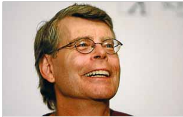
El novel·lista nord-americà Stephen King.

Stephen King és un escriptor molt hàbil. Dosifica amb destresa els elements d'intriga, la violència explícita, el pànic i una certa èpica per construir una narració fantàstica amb prou versemblança perquè el lector no pugui abandonar la novel·la fins a l'última frase. El punt flac d' El mòbil està precisament en l'intent de l'autor de racionalitzar el caos, amb el propòsit d'explicar segons la tècnica dels ordinadors el comportament insòlit dels telefònics. El final del llibre també sembla una mica forçat. Amb tot, aquestes objeccions no són prou significatives per desmerèixer una novel·la que atrapa el lector.