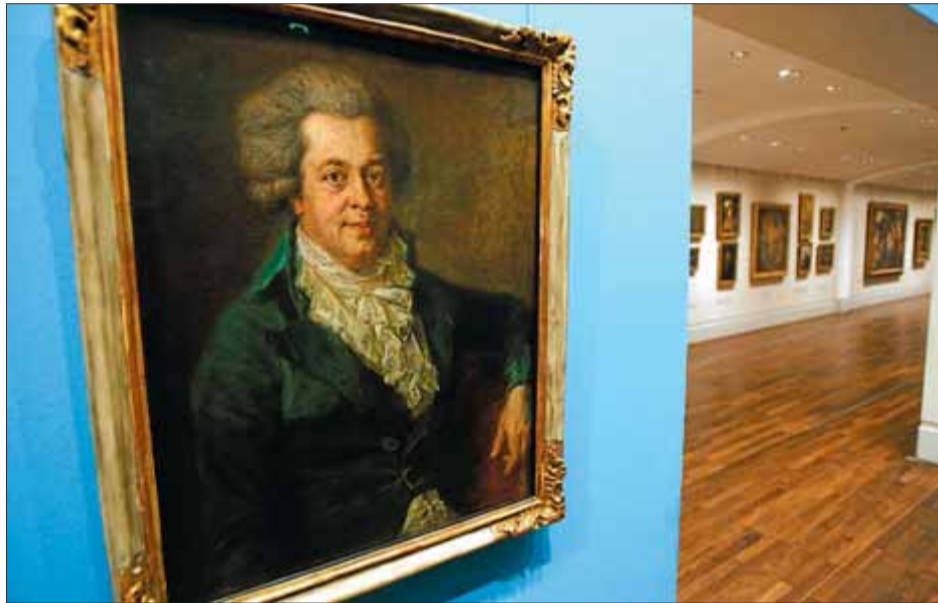
Retrat de Mozart pintat el 1790 per l'artista alemany Johann Edlinger.

L'epicentre de les celebracions del 250 aniversari del naixement de Wolfgang Amadeus Mozart va ser, l'estiu passat, la representació de tota la producció operística del compositor austríac en el Festival de Salzburg. La ciutat homenatjava així de manera exemplar el geni del seu fill més famós i lucratiu. Ara que l'Any Mozart arriba a la seva recta final, és el torn de l'última traca: Universal edita en 19 volums (33 devedés disponibles per separat o en un voluminós estoig) el fruit d'aquella ambiciosa iniciativa. Ras i curt, Mozart 22 recull totes les òperes de Mozart filmades per la productora Unitel (que també les oferirà en el seu canal televisiu, integrat en la plataforma Imagenio) entre juliol i agost al cèlebre certamen (excepte La clemenza di Tito , captada el 2003), tot i que cal fer algunes precisions aritmètiques. D'òperes, l'autor de la Sinfonia Júpiter només en va escriure 17, i, si hi sumem tres d'inacabades, en tenim 20. Les intruses són dues peces de caràcter sacre: Die Schuldigkeit des ersten Gebots i La Betulia liberata , aquesta, a més, presentada en forma de concert. No obstant, només els molt perepinyetes es queixaran, encara que el deversall de música (51 hores, complementades