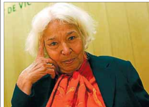
L'autora egípcia Nawal El Saadawi.

És Companys, però, qui, amb la seva erràtica trajectòria, dóna la mesura de les limitacions del projecte republicà, que certament va fer possible a Espanya una experiència democràtica i a Catalunya el recobriment del poder autònom, però que ben aviat va veure com les dificultats del trànsit del vell ordre monàrquic a la democràcia frustraven les seves ànsies d'emancipació i progrés.