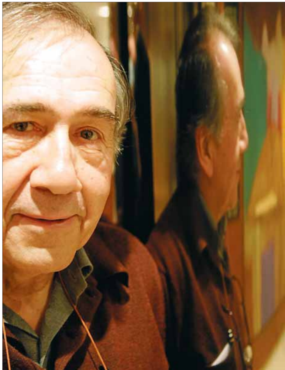
Joan Margarit diu que escrivé "sobre la vida i dintre de la vida"

Margarit té força projecció internacional. Fa poc que és al carrer l'antologia Tugs in the Fog , amb 170 poemes seus en anglès, i aquest 2007 en sortirà una altra en català i alemany. ■