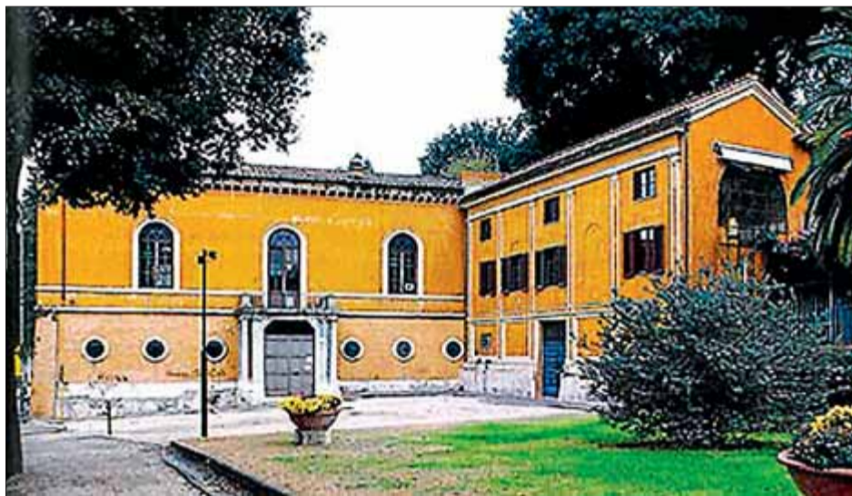
Una imatge de la façana principal de l'Aranciera, a la Villa Borghese, a Roma. SP

L'Aranciera. Projectat i aixecat pel cardenal Scipione al segle XVII, l'edifici de l'Aranciera es va convertir en seu de grans festes i esdeveniments en època de Marcantonio IV Borghese (1730-1800) que el