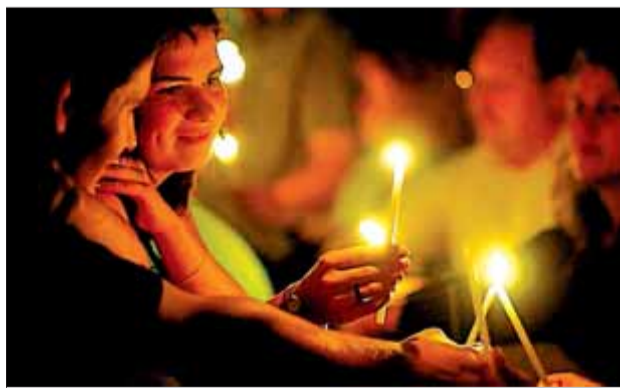
Joves que potser tenen 'Cançons a flor de llavis'. STF

Fa temps que tenia ganes de recuperar algun d'aquells cançons que corrien per casa i pels focs de camp, llavors que els fills del baby boom començàvem a néixer i, any més any menys, a guitarrear. En recordo un de rebregat per l'ús, Cançons a flor de llavis , i ara que el busco no hi ha manera de trobar-lo. Potser l'ús no només el va esgrogueir. Potser es va malmetre tant que finalment algú el va llençar. O es va extraviar qui sap on, qui sap quan. Aquest cançoner obria la col·lecció Esplai ,