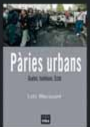
Pàries urbans (Guetos, banlieues, Estat) Loïc Wacquant