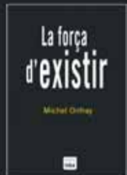
La força d'existir Michel Onfray