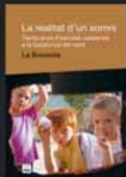
La realitat d'un somni (Trenta anys d'escoles catalanes a la Catalunya del nord) La Bressola