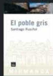
El poble gris Santiago Rusiñol