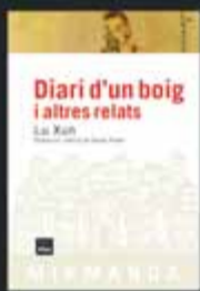
Diari d'un boig i altres relats Lu Xun