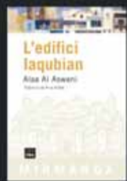
L'edifici laqubian Alaa Al Aswani