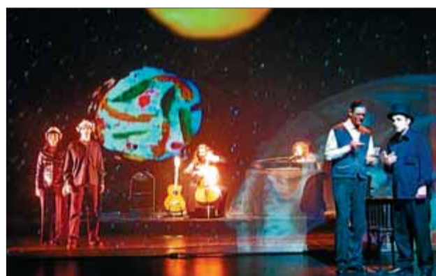
Tosar reproduceix el somni de diferents poetes sota l'òptica d'Antonio Tabucchi ■ SALA MUNTANER