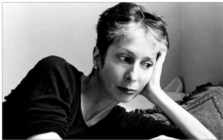
Deborah Eisenberg ha guanyat els premis de narració més prestigiosos.