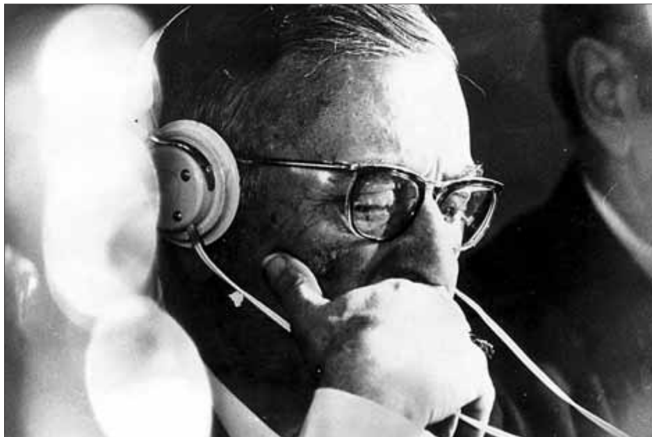
Jean-Paul Sartre, autor de 'Defensa dels intel·lectuals'.

L'estiu passat Albert Sánchez Piñol escrivia en un diari que, arran dels canvis socials que va promoure la Revolució Francesa, la figura de l'escriptor va assumir el paper de líder espiritual que fins llavors havien ostentat els prelats de l'Església i que els polítics no van saber guanyar-se. Això, que és més veritat a Europa que aquí, va comportar, entre altres, la problemàtica encara avui no resolta del paper de l'es-