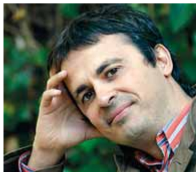
El poeta i narrador Hèctor Bofill

M'apresso a dir que no fóra gens exacte parlar de novel·la filosòfica, però sí, per entendre'ns, de novel·la d' idees amb una decidida vocació d'interpel·lar el lector i convidar-lo a plantejar-se algunes de les qües-