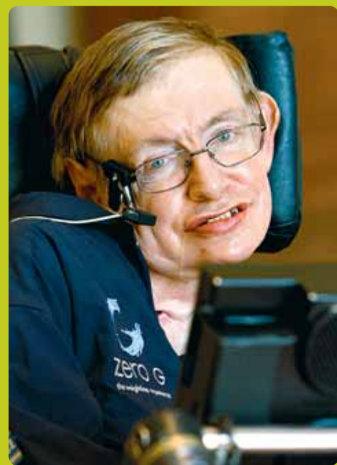
Stephen Hawking