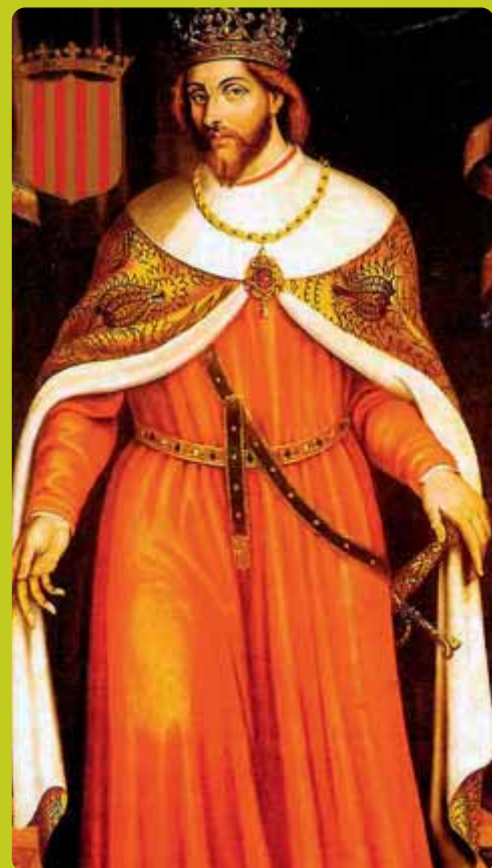
Jaume I / AVUI

Una de les teories més revolucionaries del segle XX en ecologia ha estat la hipòtesi de Gaia, enunciat per Lovelock el 1972, una metàfora sobre la Terra viva que explica exquisidament el dinamisme del nostre planeta mitjançant la interrelació de tots els elements que en formen part,