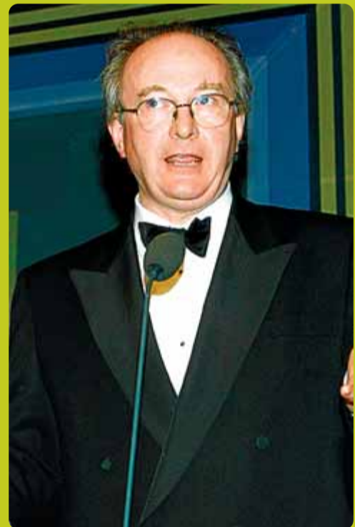
Philip Pullman