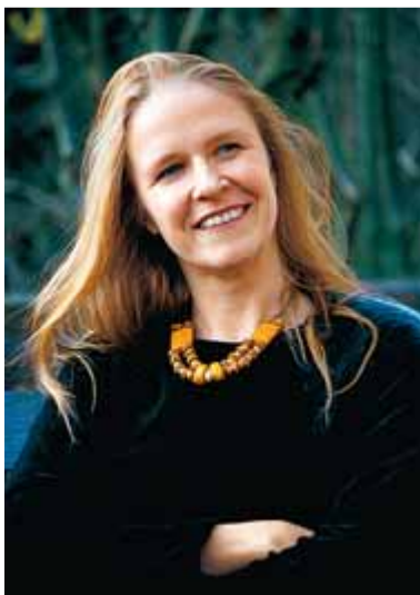
La novel·lista alemanya Cornelia Funke va néixer a Dorsten el 1958

És a dir, utilitza elements que formen part de la tradició del gènere: les fades, el bosc, l'ogre, la reina, els poders sobrenaturals... I fins i tot els dona una patina de clàssic amb