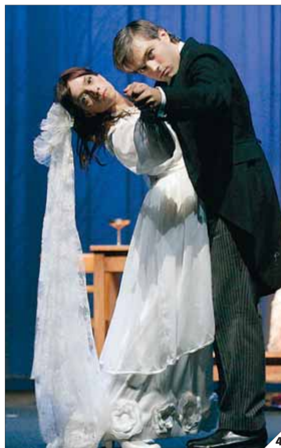
1. Ricard Salvat davant el teatre municipal d'Aquisgrà (Alemanya), en una imatge d'arxiu no datada 2. 'Ronda de mort a Sinera' va trepitjar el Lliure el 2002 3. Ricard Salvat el 1992 4. 'Un dia. Mirall trencat' va ser l'última obra que va dirigir

va formar un grup teatral amb la intenció d'arriscar. El 1959, en tornar d'Alemanya, posaria en pràctica tot el que hi havia après, que passava pel realisme èpic brechtian, una dicció acurada i la fusió de les arts damunt l'escenari.