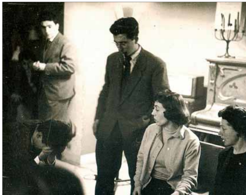
Un assaig del Teatre Viu al Centre Artístic de Sant Lluç el 1958