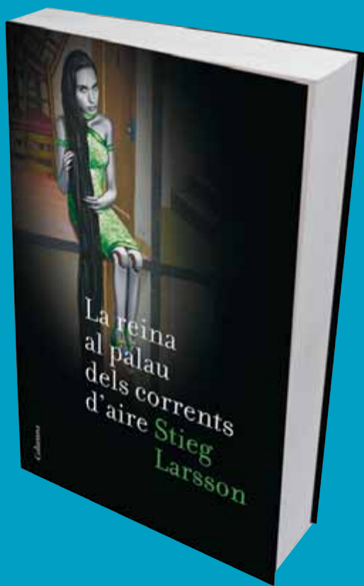
La reina al palau dels corrents d'aire

Us oferim un tast de l'esperat tercer volum que tanca la trilogia de Stieg Larsson, 'La reina al palau dels corrents d'aire'. El 18 de juny es podrà llegir en català (Columna) i en castellà (Destino). I divendres vinent s'estrena a les nostres pantalles, i en català, la versió que s'ha fet del primer dels volums de la trilogia, 'Els homes que no estimaven les dones'. Us avancem imatges d'aquest film suec dirigit per Niels Arden Opley, que ha encabit de manera admirable les 750 pàgines del llibre en dues hores i mitja de metratge