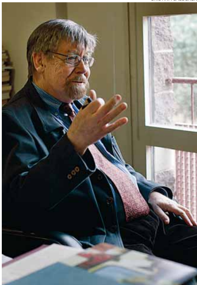
Baltasar Porcel va conrear tota mena de gèneres

Baltasar Porcel Destino Barcelona, 2009 Preu: 20 euros Pàgines: 424