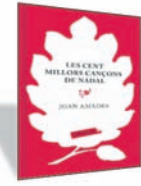
■ Joan Amades Les cent millors cançons de Nadal La Butxaca