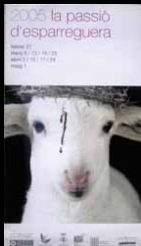
Cartell any 2005.