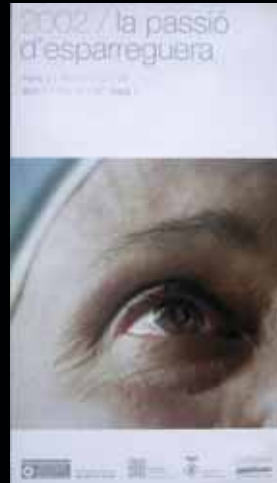
Cartell any 2002.