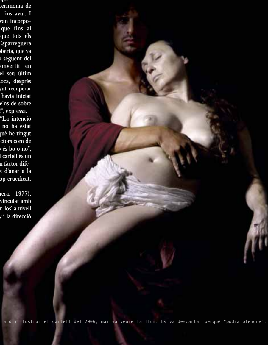
Aquesta foto, que havia d'il·lustrar el cartell del 2006, mai va veure la llum. Es va descartar perquè "podia ofendre".

La Passió es representarà els dies 3, 10, 17, 22 i 30 d'abril i el dia 1 de maig al teatre La Passió d'Esparreguera. ■