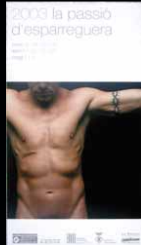
Cartell any 2003.