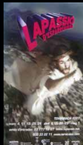
Cartell any 2007.