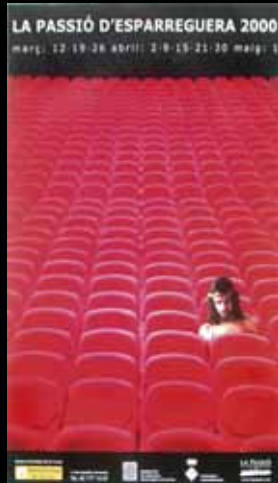
Cartell any 2000.