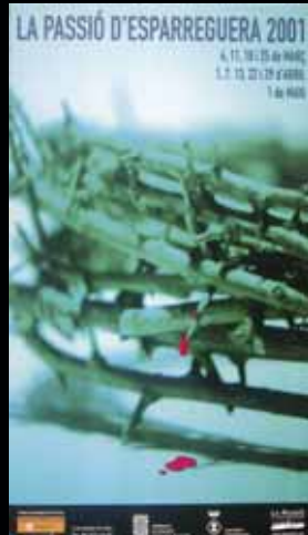
Cartell any 2001.