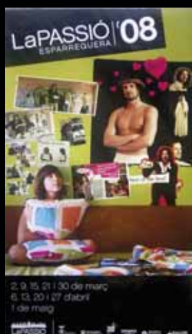
Cartell any 2008.