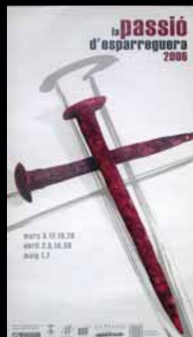
Cartell any 2006.