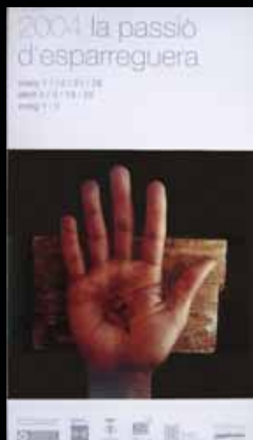
Cartell any 2004.