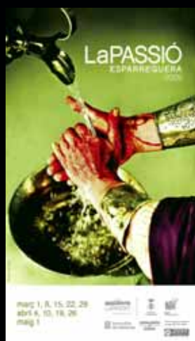
Cartell any 2009.