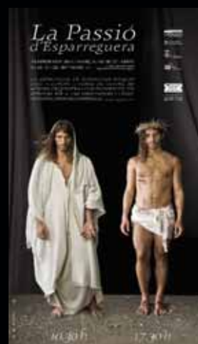
Cartell any 2011.