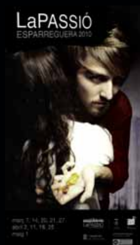
Cartell any 2010.