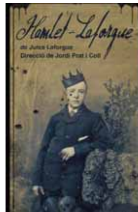
Hamlet-Laforgue, segona producció de la sala, es podrà veure fins el proper 1 de maig i descobrir el mite shakerà amb una nova mirada incisiva, divertida i mordaç.

Penso que sí, sense cap mena de dubte. S'ha de crear una identitat. Fa molts anys que la gent no va a veure un teatre, sinó que va a un espectacle, ara aquí, ara allà... I nosaltres venim d'una generació diferent. Recordo abans, quan al Poliorama hi havia en Josep Maria Flotats, tu hi anaves i sabies que anaves a veure un tipus de teatre. I l'obra, en el fons, era relativament important. El que era important era l'equip, la manera, el punt de vista... I al Lliure de Gràcia passava exactament el mateix. Penso que hem d'assolir aquesta gran ambició que és que la gent vingui a Atrium, no a veure una obra concreta, sinó a cegues, perquè sabrà que la proposta estarà bé i li dirà alguna cosa. Crec que l'especialització és important, però no vol dir marginar. Serà el nostre punt de vista genuí. I crec que a Barcelona hi ha públic per a Atrium, tenim el nostre target .