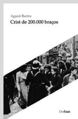
BARTRA, Agustí. Crist de 200.000 braços . ISBN: 978-84-96664-77-7. PVP: 12 €