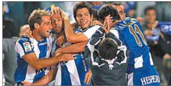
El Espanyol ganó al Madrid el pasado octubre.

Lucas da varias razones para asentar con solidez el sentimiento perico: apostar por la diversidad, enfrentándose al pensamiento único y a la globalización deportiva; ser minoritario, marcar la diferencia; colocarse al lado del débil; ser de un equipo que mima la cantera, algo que le otorga una gran personalidad en el paisaje futbolístico catalán lo que, a pesar de las dificultades, crea fidelidad. En areaperica , un socio aporta más gramaje filosófico para seguir en este club: "Sólo los peces muertos siguen la corriente". Una muestra de lo mal que se vive con los reproches injustos lo da un post-it colgado en el tablón de laveudelespanyolista : "Ser perico es también ser catalán".