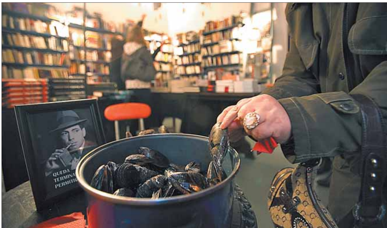
Una cliente de la librería Negra y Criminal degusta los mejillones de los sábados por la mañana.