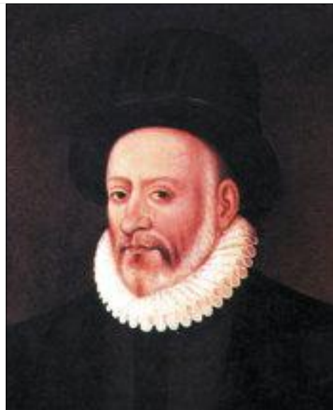
Montaigne, traductor de la vida ondulant.