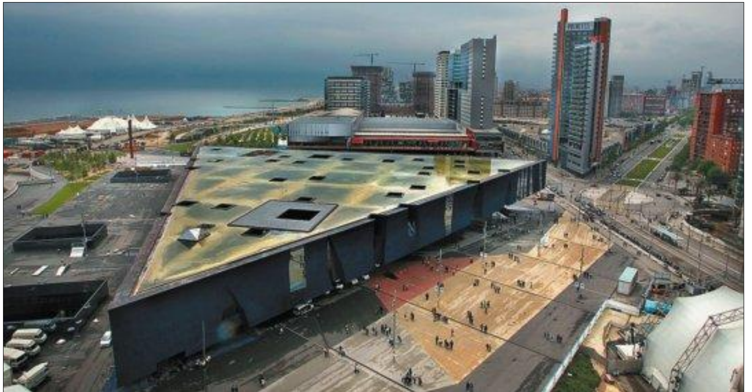
Han calgut quatre anys per poder reflexionar críticament sobre el que va suposar el Fòrum 2004, el recinte del qual apareix a dalt.

"Segons X, cal aprendre per saber qui mana". Per saber què pensa X cal llegir aquest llibre irònic i lúcida, a mig camí entre l'assaig, el microconte i el recull d'aforismes sobre la societat d'avui.