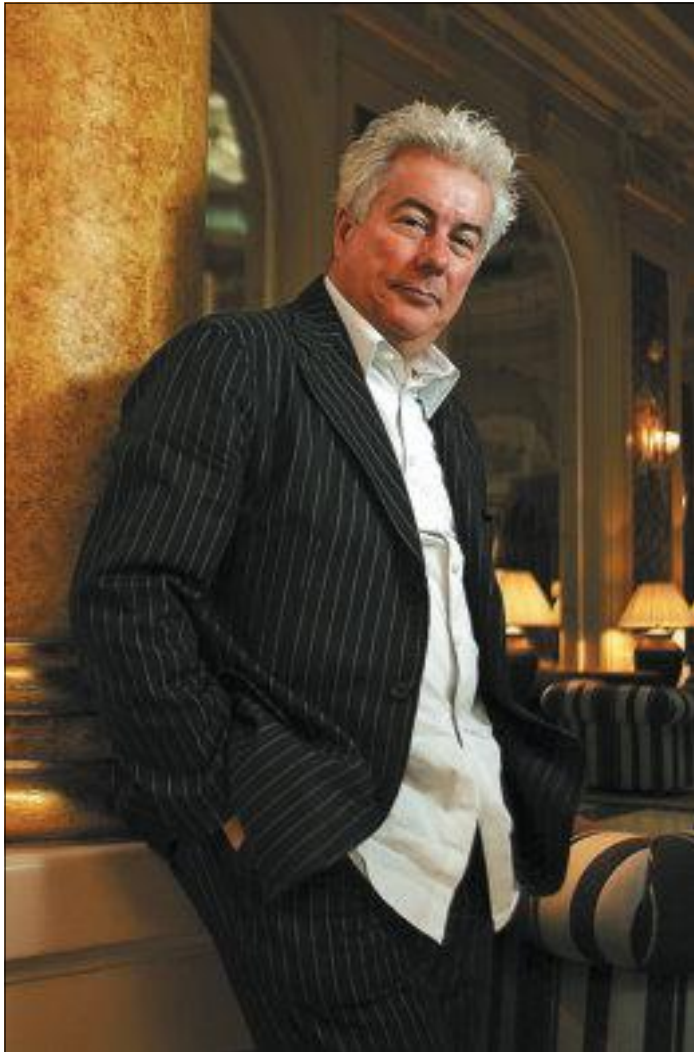
Ken Follett, arquitecte d'un entramat d'intriga, aventura i erotisme.

Després de 10 intents més aviat infructuosos, Follett va tastar les mels de l'èxit amb El ojo de la aguja , premi Edgar Allan Poe 1979. El mestre de la intriga, l'aventura i l'erotisme ha passat per la novel·la d'espionatge i pels thrillers tecnològics en la línia de Michael Crichton, però ha trobat la gallina dels ous d'or en la novel·la històrica. Fa quasi 20 anys va erigir un imperi comercial i literari paral·lel a la construcció d'una catedral medieval en un poble imaginari de la Gran Bretanya. Ara, el boomerang d'aquesta saga èpica retorna amb ímpetu vertiginós en la seqüela Un món sense fi . L'obra transcorre durant tres dècades al Kingsbrige del segle XII i relata la lluita dels seus habitants contra la misèria, la demagògia dels poderosos i la temible mort negra. Dos-cents anys després, el temple erigit amb sang, suor i llàgrimes a Els pilars de la Terra s'està esfondrant. El repte de reconstruir-lo reflecteix la necessitat de restaurar l'economia, la jus-