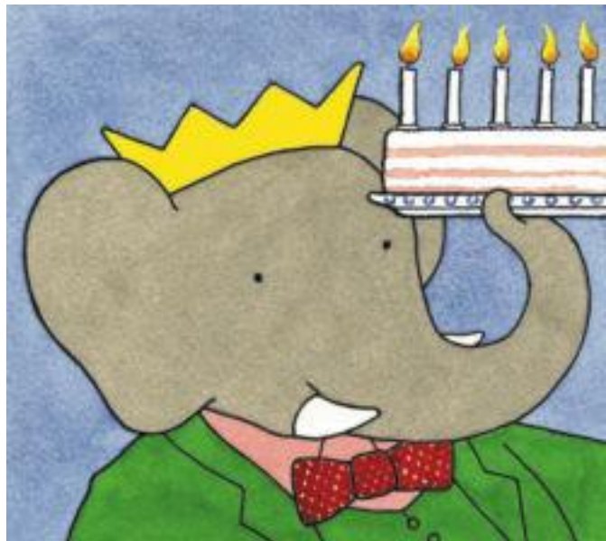
Imagen de Babar, personaje analizado por Pep Molist en Dentro del espejo .

A ESTAS ALTURAS, y sobre todo tras los malos datos del último Informe PISA sobre comprensión lectora, nadie se atrevería a negar la importancia de la lectura en la formación de los más jóvenes. Fomentar la lectura, formar lectores competentes, iniciar a los niños en la lectura desde la cuna son ideas que se repiten en todos los foros especializados y que, poco a poco, parecen estar