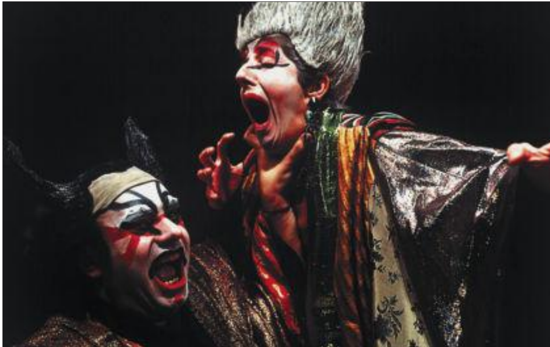
Una escena de Mikado , l'opereta de Gilbert i Sullivan que Dagoll Dagom va adaptar. / MARIA MORENO

Que el teatre ja no és el que era ho, admet gairebé tothom, en-