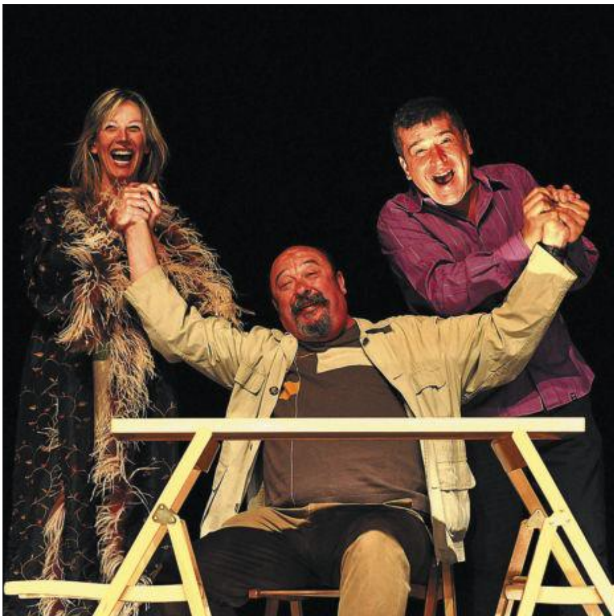
Còmica vida , el muntatge que Dagoll Dagom representa al teatre Micalet, de València.